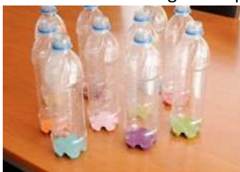
DIY PLASTIC BOTTLE BOWLING

Prazne plastenke lahko napolnite z različnimi polnili, ali samo z vodo. (lahko jo tudi obarvate s tempera barvami). Bodite pazljivi, da pokrovčke dobro zaprete ali oblepite s tiskarskim trakom. Vzamete žogo in se potrudite zadeti čim več kegljev.